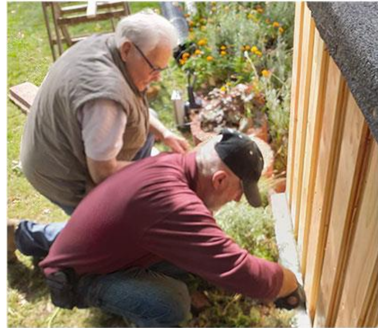
Alle packen bei der Umgestaltung des Gartens mit an

Der neue Grill ist das Lieblingsstück der Männergruppe Kräuter der angelegten Hochbeete bereichern das Seniorenfrühstück Gemeinsame Arbeit an Hochbeeten hat die Männer als Gruppe gestärkt